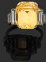
Bague saphir jaune 10.58 carats Adjugée 8 800 €