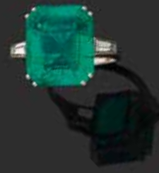
CHAUMET Paris - Bague émeraude de 9.36 carats Adjugée 16 500 €

POUR INCLURE UN LOT DANS CETTE VENTE OU POUR TOUTE ESTIMATION GRATUITE CONTACTER L'ÉTUDE 01 47 70 36 16