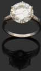
CHAUMET Paris - Bague diamant 5.91 carats Adjugée 31 500 €