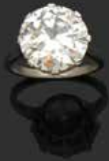
Bague diamant de 6.25 carats. Adjugée 36 500 €