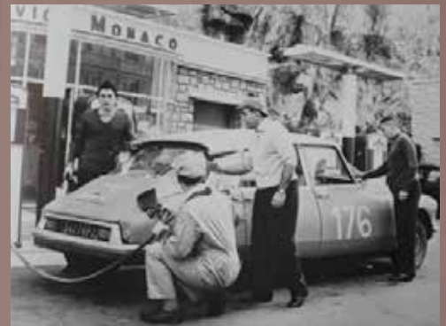
L'équipe faisant le plein durant la course.