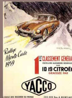
Publicité Yacco, sponsor de Coltelloni.