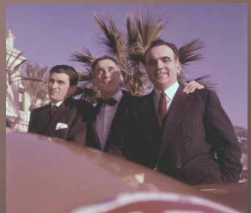
Le sourire des vainqueurs.