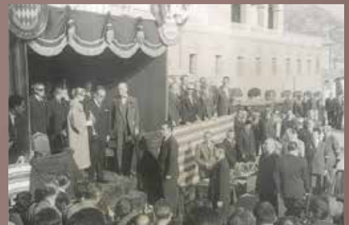
Remise du trophée par la Princesse et le Prince de Monaco.