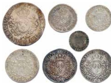
66 Revers, taille réelle