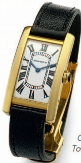
Cartier Tonk cintrée