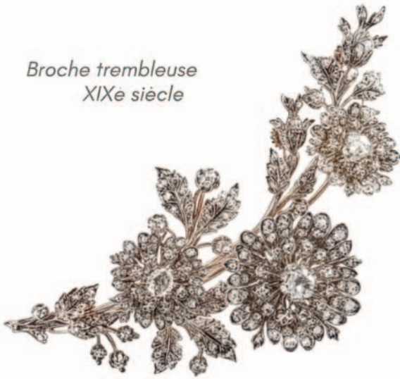
Broche trembleuse XIX e siècle