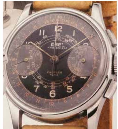
Above: a similar model illustrated in Paul White's reference work I Cronografi Da Polso: Preziose Memorie del XX Secolo , Volume II (Milla Editore).