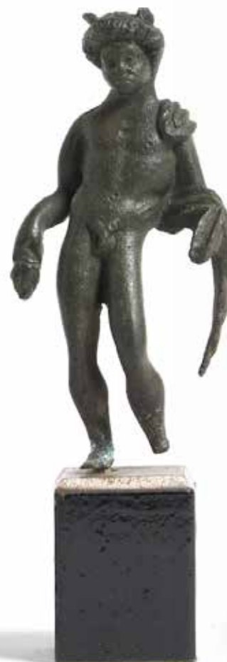
27 - Figurine de Mercure au drapé tombant sur l'épaule gauche et sur son bras. Il tient la bourse. Deux ailes dépassent de son épaisse chevelure. Bronze à patine noire. Pied gauche manquant. Art romain, II e /III e siècle H : 8 cm