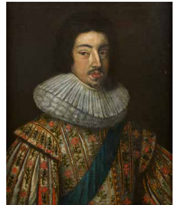
87 - École FRANCAISE du XVII e siècle, entourage de Daniel DUMONSTIER Louis XIII Toile marouflée sur panneau 69 x 56 cm 800/ 1 200 €