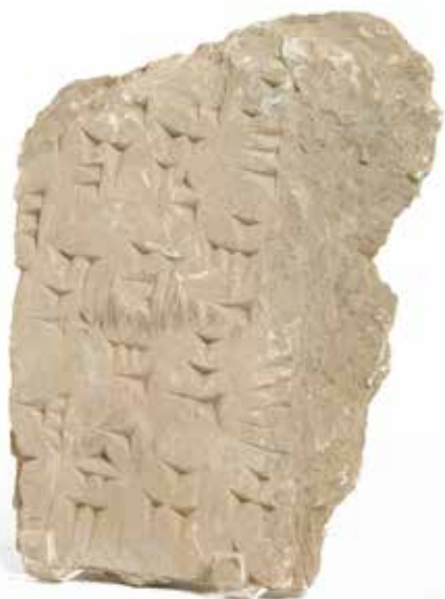
34 - Fragment orthostate inscrit de caractères cunéiformes Mésopotamie période néo-assyrienne 24,5 x 17 cm H : 3,5 cm