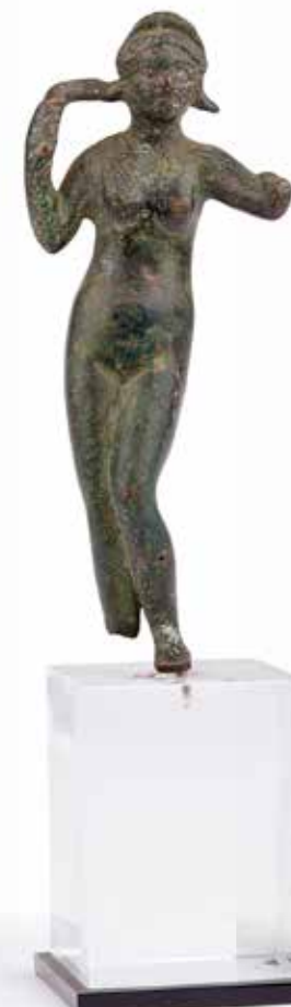
28 - Vénus anadyomène impudique Bronze à patine verte lisse. Pied droit manquant et bras gauche manquant. Époque romaine H. : 9,5 cm