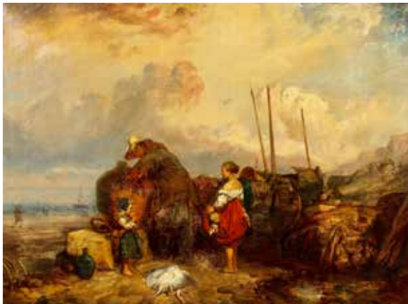
126 - J. MARCOTTE, d'après Eugène Le POITTEVIN (Actif en 1847) Pêcheurs sur la plage Sur sa toile d'origine 50 x 66,5 cm Signé et daté en bas à gauche J. Marcotte/ d'après le Poittevin 1847