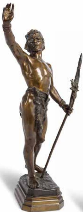
287 - D'après Luis DOMENECH Y VICENTE (1873-?) Le messager de la paix Groupe en bronze à patine brun vert H: 41 - L: 19 - P: 9.5 cm. Signé sur la terrasse L Domenech