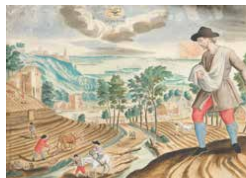
69 - Jan Collaert II et Adriaen Coolaert, d'après Joos de Momper le jeune, publiées par galle Les Mois

Suite de sept gravures au burin et eau forte rehaussées à la gouache Certaines estampes signées 18 x 25 cm