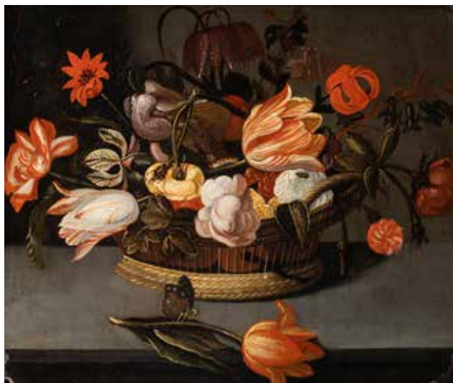
93 - École HOLLANDAISE vers 1640, suiveur de Johannes BOSSCHAERT Nature morte à la corbeille de fleurs Panneau de chêne, une planche, non parqueté 24 x 29,5 cm Restaurations 3 000/4 000 €