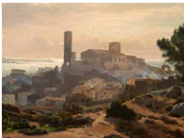
113 - Adolphe Etienne VIOLLET LE DUC (1817-1878) Vue du Suquet à Cannes Huile sur papier marouflée sur carton 25 x 37 cm Signé en bas à gauche a Viollet le Duc