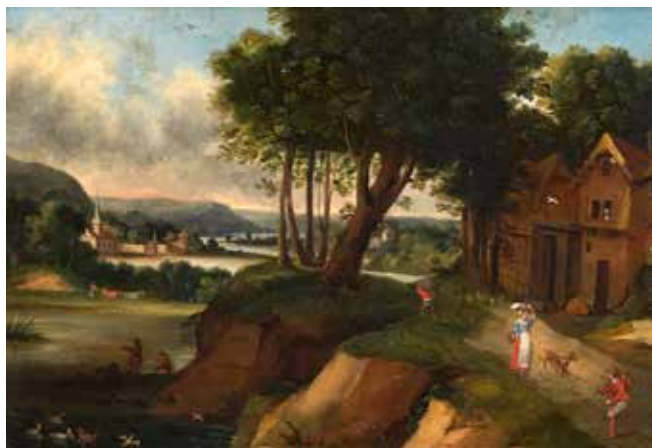
120 - École FLAMANDE du XIX e siècle, dans le goût de GRIMMER Chaumière près d'une rivière Cuivre 18,5 x 30 cm Restaurations