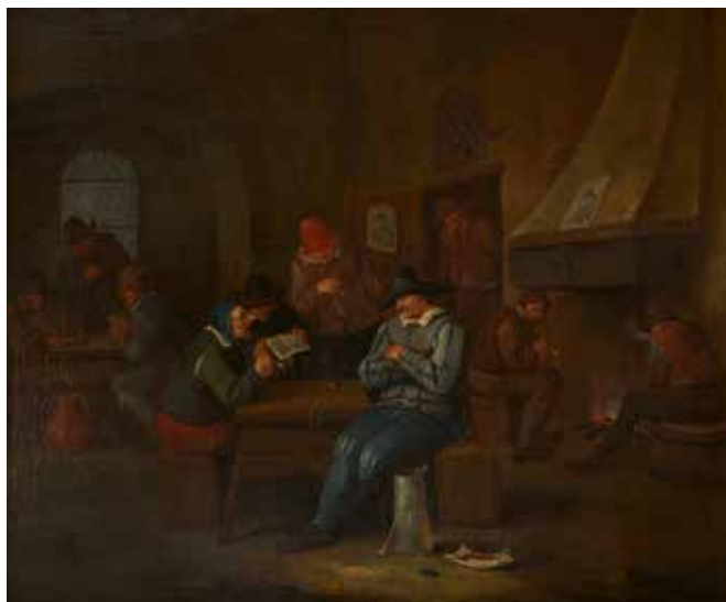
81 - Attribué à Adriaen BROUWER (1605/06 - 1638) Le fumeur Panneau de chêne préparé 35,5 x 28 cm