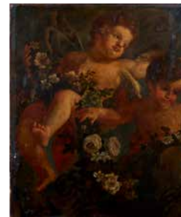
96 - École ITALIENNE du XVIII e siècle Deux putti tenant des guirlandes de fleurs Toile, un fragment 84 x 69 cm Accidents et restaurations Sans cadre