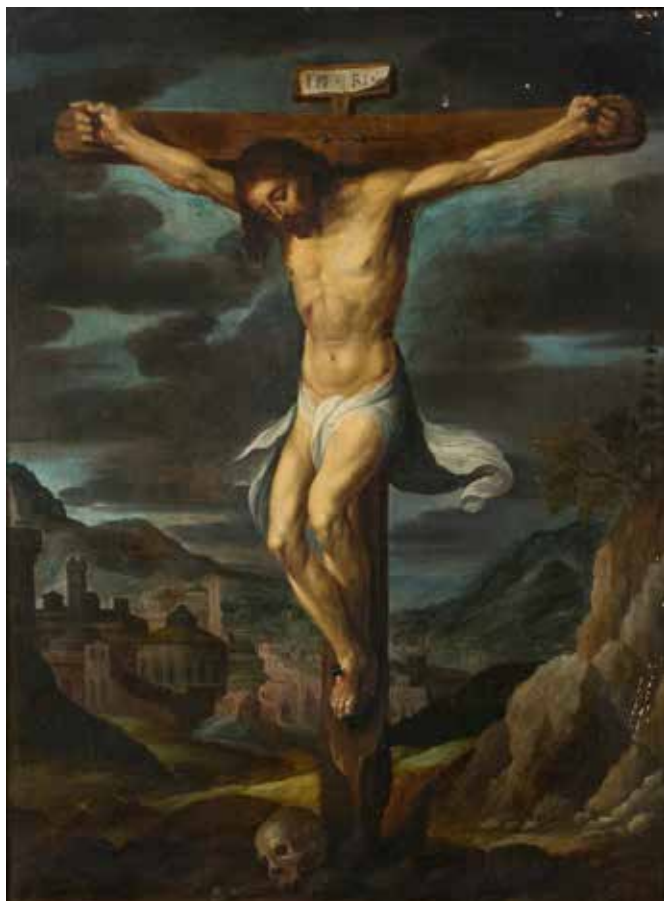
66 - Otto VENIUS (Leyde 1556 - Bruxelles 1629) La Crucifixion Panneau de chêne une planche non parqueté 67,5 x 49,5 cm