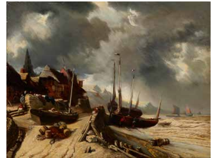
129 - Eugène ISABEY (1803-1886) Bord de côte, l'approche de la tempête Huile sur panneau 50 x 65 cm Signé en bas à gauche du monogramme de l'artiste