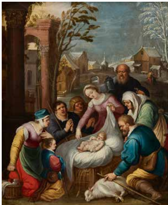
71 - École FLAMANDE vers 1640, atelier de Frans FRANCKEN L'Adoration des bergers École FLAMANDE vers 1640, suiveur de Frans FRANCKEN L'Adoration des Bergers Cuivre 35 x 28 cm Reprise du tableau de Francken conservé à la National Gallery of Ireland de Dublin. 800/1 200 €