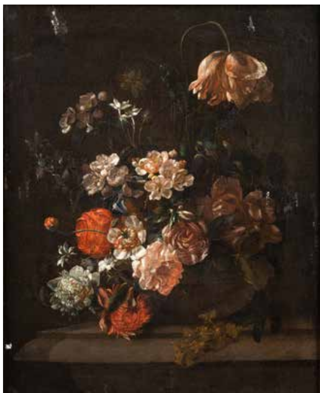
94 - École FRANÇAISE de la fin du XVII e siècle, entourage de Jean-Baptiste MONNOYER Fleurs sur un entablement Toile 61 x 49,5 cm Manques 1 500/2 000 €