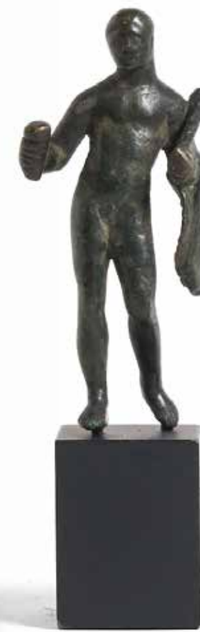
29 - Figurine d'Hercule imberbe tenant sur son bras gauche la massue et la léonté Bronze à patine marron lisse. Usure Période romaine H : 7,8 cm