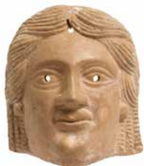
26 - Masque de théâtre comique représentant une femme au léger sourire Terre cuite beige Afrique du Nord ?, période romaine H : 13 cm