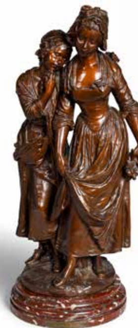
291 - D'après Hippolyte François MOREAU (1832-1927) Les deux sœurs Épreuve en bronze à patine brune sur socle en marbre rouge H: 72 cm Signé sur la terrasse Usures