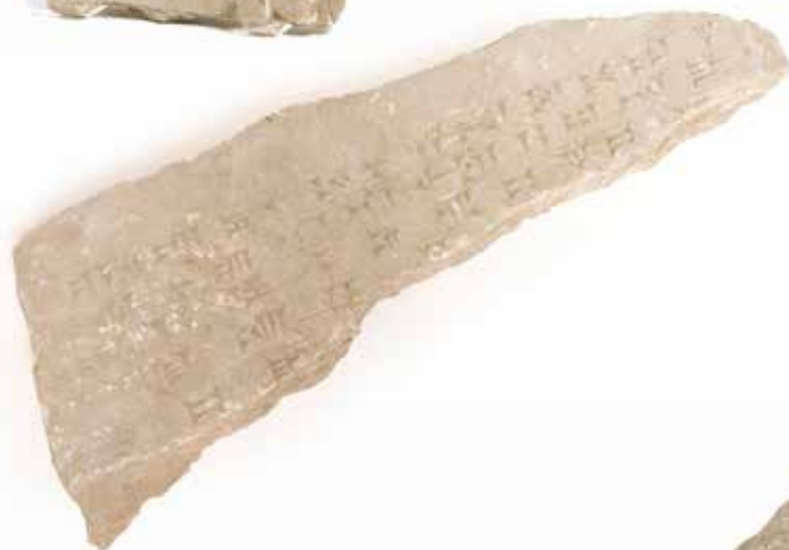
35 - Fragment d'orthostate inscrite sur 5 lignes de caractères cunéiformes Calcaire gris Mésopotamie, période néoassyrienne. 54 x 20 cm H : 6 cm