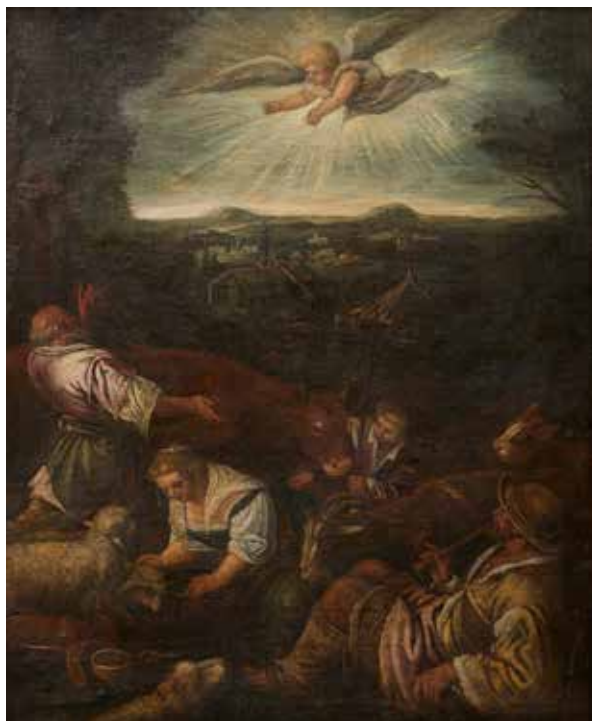
70 - École VENITIENNE du XVII e siècle, atelier de Jacopo BASSANO L'Annonce faite aux bergers Toile 83,5 x 70 cm 1 500/3 000 €