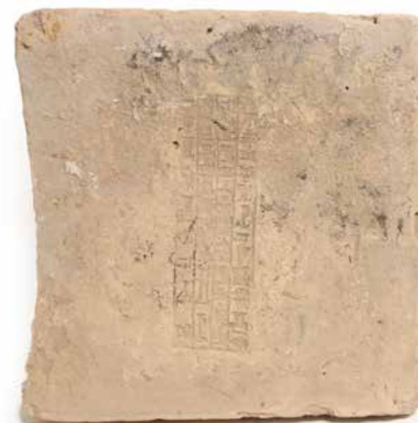
38 - Important fragment d'orthostate inscrits de caractères cunéiformes Gypse gris. Usures Mésopotamie période néo-assyrienne 34 x 22 cm H : 8 cm