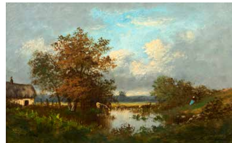
116 - Jules DUPRÉ (1811-1889) L'Abreuvoir, environ de l'Isle-Adam Huile sur toile 39 x 61 cm Signé en bas à droite Jules Dupré