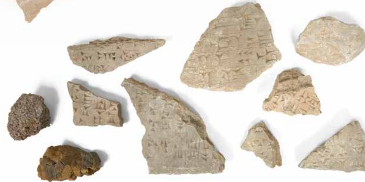
36 - Réunion de huit fragments d'orthostates inscrites de caractères cunéiformes Gypse gris accidents et usures Mésopotamie période néo-assyrienne 27 x 20 cm H : 5 cm pour le plus grand et 13 x 9 cm H : 6 cm pour le plus petit