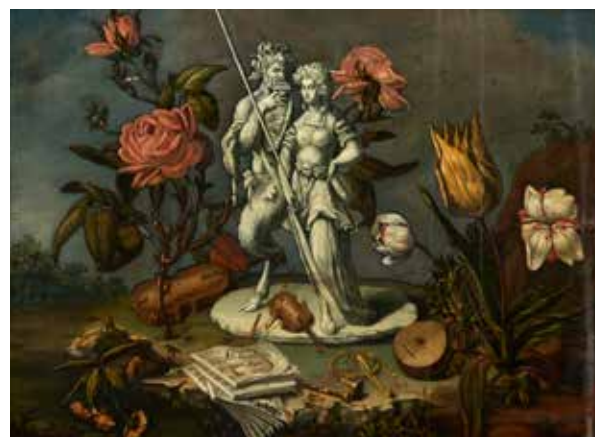
95 - École ITALIENNE de la fin du XVIII e siècle Statue de Pan et une nymphe au milieu de roses, violons et partition Panneau préparé 41 x 56 cm

Probablement un hommage à Antonio Bisoni, compositeur d'opéras bolonais à la fin du XVIII e siècle.