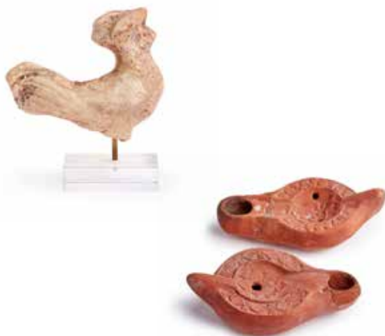
25 - Lot comprenant une figurine de coq. Terre cuite rose. Période romaine H. : 8,5 cm

Ainsi que deux lampes à huile à bec à canal orné de motifs géométriques pour l'une, et d'un personnage avec un cheval pour l'autre. Terre cuite orange. Becs restaurés. Afrique du Nord, V e - VII e siècle après J.-C.