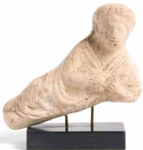
24 - Fragment de banqueteur couché tenant une couronne de fleurs et une coupe Terre cuite beige. Syro-Jordanie, période romaine. H : 9 - L : 10 cm