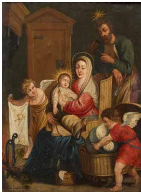
74 - École FLAMANDE vers 1650 La Sainte Famille et les anges Cuivre 31 x 23,5 cm Porte une signature en bas à gauche Quellinus Fec./anno 1667